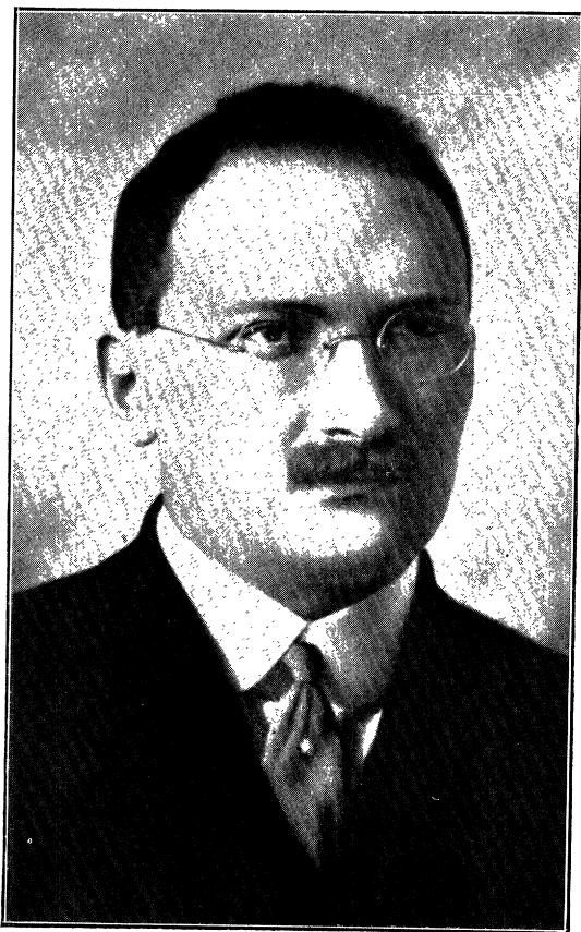
ד. ב. באראכאָוו געבאָרען ז' תמוז, תרמ"א—יוני, 1881. געשטאָרבען טבת, תרע"ח—דעצ. 1917.